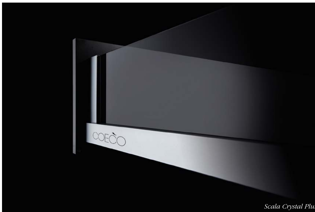
Scala Crystal Plus