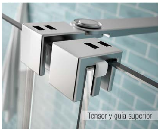
Tensor y guía superior