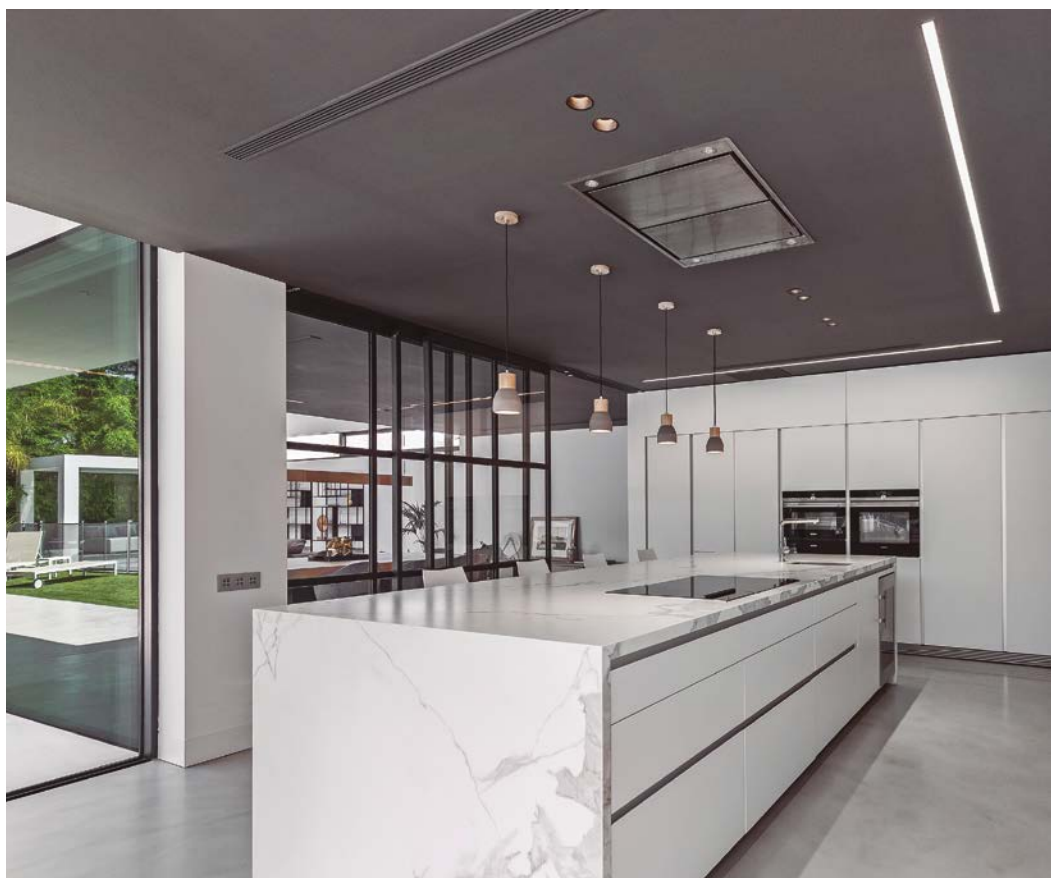
La cocina, totalmente en blanco, sorprende por sus generosas dimensiones y su apertura al exterior

Las escaleras de acceso a las diferentes plantas, formadas por peldaños de chapa de hierro doblada y lacada, quedan acotadas por paneles acristalados en la parte inferior y superior. Para la iluminación se han escogido distintas lumi-