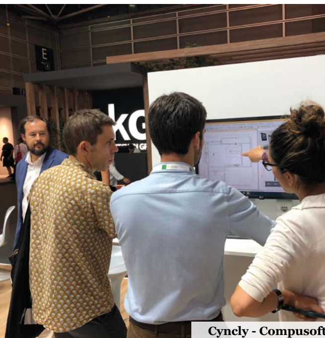
Cyncly - CompuSoft