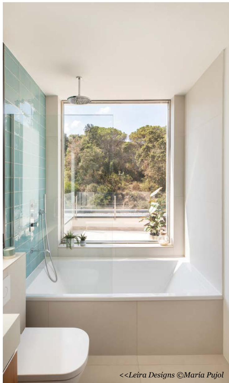
<<Leira Designs ©María Pujol

Cinco estudios de interiorismo han seleccionado entre sus proyectos un baño que incluye algún elemento que destaca por su innovación. Las últimas tecnologías ya forman parte de griferías, espejos, iluminación, vidrios, sanitarios... Y cada vez son más los usuarios que las solicitan según sus gustos, necesidades o caprichos.