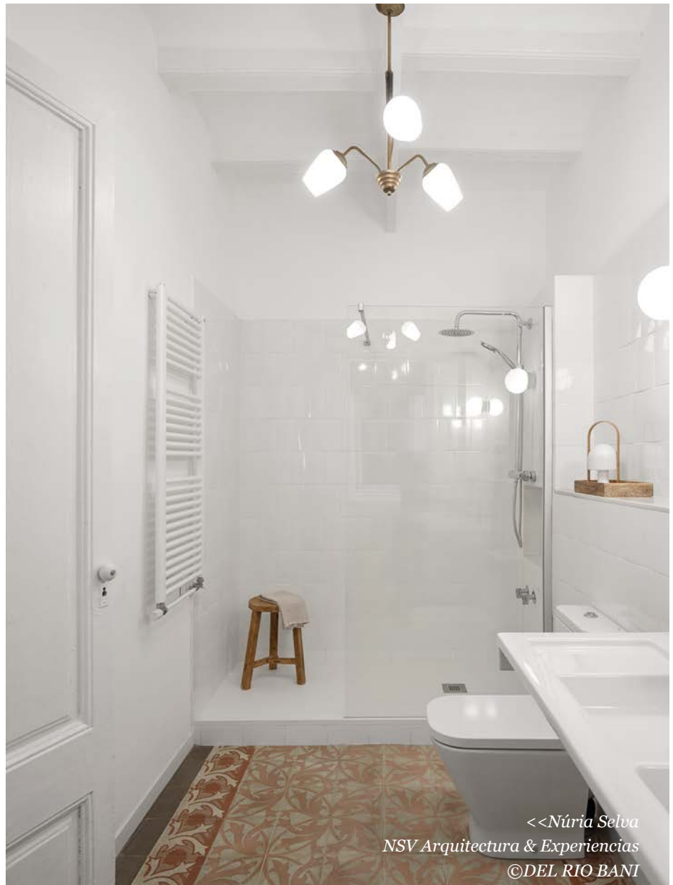
<<Núria Selva NSV Arquitectura & Experiencias