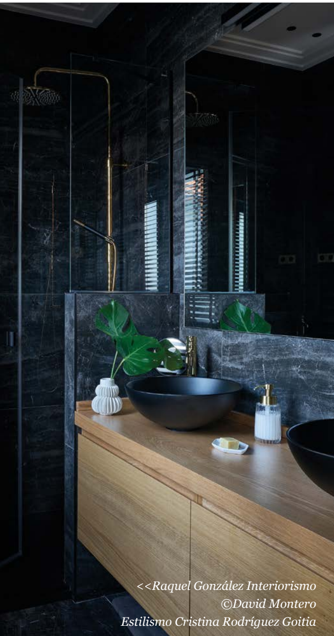
<<Raquel González Interiorismo ©David Montero Estilismo Cristina Rodríguez Goitia

“La piedra se convierte este 2023 es uno de los materiales más deseados para diseñar los baños”