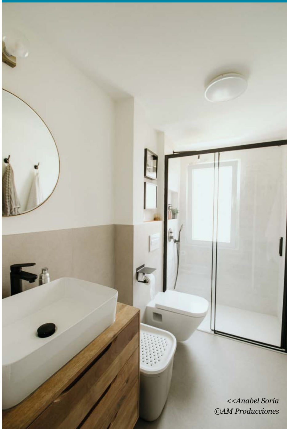
<<Anabel Soria ©AM Producciones

En cuanto a las características de las griferías y los sanitarios, "en primer lugar hay que tener en cuenta las necesidades del usuario final; luego ya vendrá el estilo y los acabados, dependiendo de la vivienda" , recomienda Núria Selva. Por su parte, Anabel Soria considera que para elegir ambos elementos "hay que tener claro el diseño y lo que queremos conseguir o resaltar" . Hay proyectos de baños en los que se busca generar más contraste o ser más atrevidos o, por el contrario, el cliente demanda tonos neutros para pasar lo más desapercibidos posibles. Los consejos de Soria son: grifería de latón para un baño clásico con muebles de molduras; grifería negra mate en un baño de diseño o colores muy claros, y grifería con acabado cromo, "o incluso blanco, que ahora está tan de moda" , para ese baño cuya base ya es