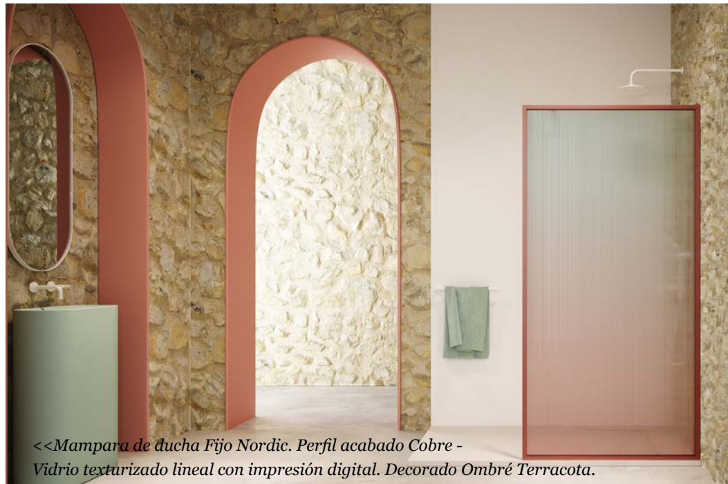
<<Mampara de ducha Fijo Nordic. Perfil acabado Cobre - Vidrio texturizado lineal con impresión digital. Decorado Ombré Terracota.

El usuario es el que marca sus líneas y personaliza el producto para adaptarlo a su personalidad