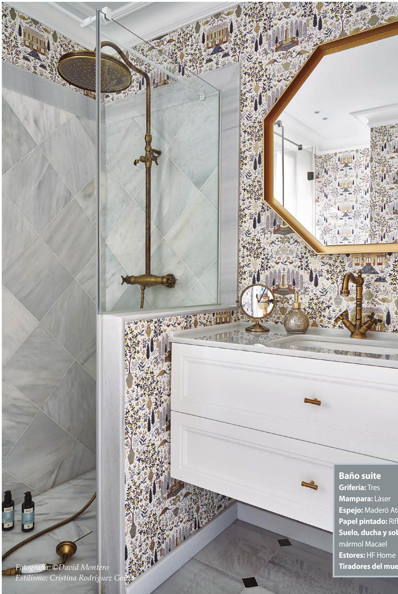
Baño suite Grifería: Tres Mampara: Láser Espejo: Maderó Atelier Papel pintado: Rifle Paper Co. Suelo, ducha y sobre del lavabo: mármol Macael Estores: HF Home Tiradores del mueble: Formani

Estilismo: Cristina Rodríguez González