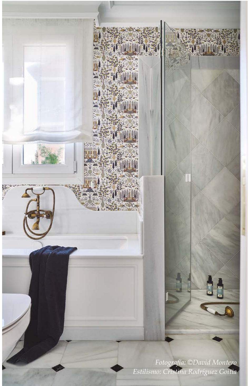
Estilismo: Cristina Rodríguez Goñia

A la pregunta de cuál es su valoración del resultado final de este nuevo baño en suite, tras la reforma de todo el piso, responde: “¡Qué voy a decir yo, es mi baño! El estilo, cómo se ha resuelto... Lo cierto es que está de capricho, para mí. ¡Es ideal! No tengo ningún baño como este. Yo le doy un 10 y todas las visitas alucinan”. ■