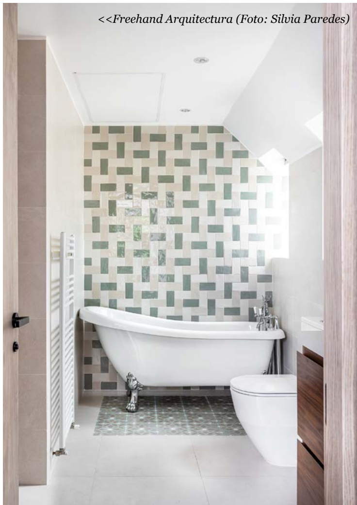
<<Freehand Arquitectura

Treviño valora especialmente la calidad y durabilidad de los materiales, “ya que el baño es un espacio de uso intensivo dentro de la vivienda” . Y también considera importante que el proveedor ofrezca variedad estética (colores, medidas, acabados...) para poder adaptar el producto a diferentes estilos de proyectos, con disponibilidad de muestras en la fase de diseño “para tomar decisiones con mayor precisión dentro del proyecto” . La suma de todas estas necesidades que deben cubrir los proveedores de bañeras y duchas, “son factores clave para garantizar que la solución elegida funcione correctamente a lo largo del tiempo” , declara el arquitecto y fundador de DmasC.