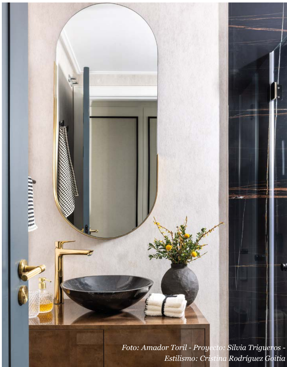
Proyecto: Silvia Trigueros - Estilismo: Cristina Rodríguez Goitia